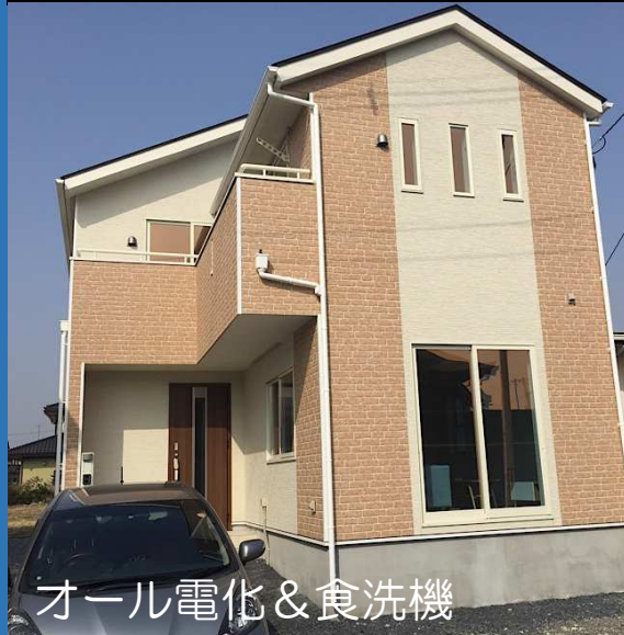
オール電化 & 食洗機