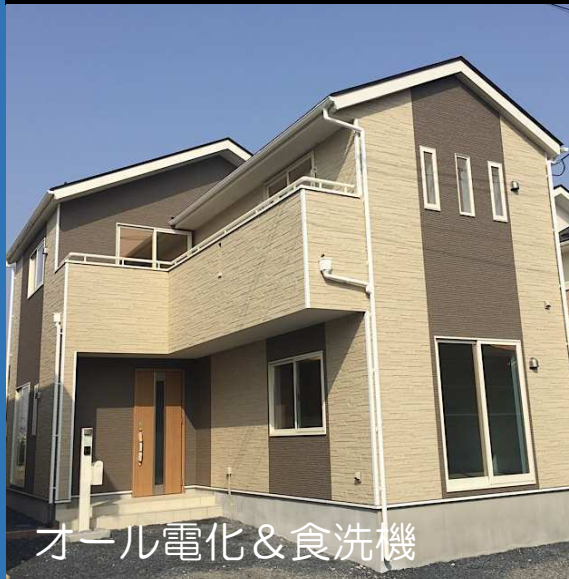
オール電化 & 食洗機